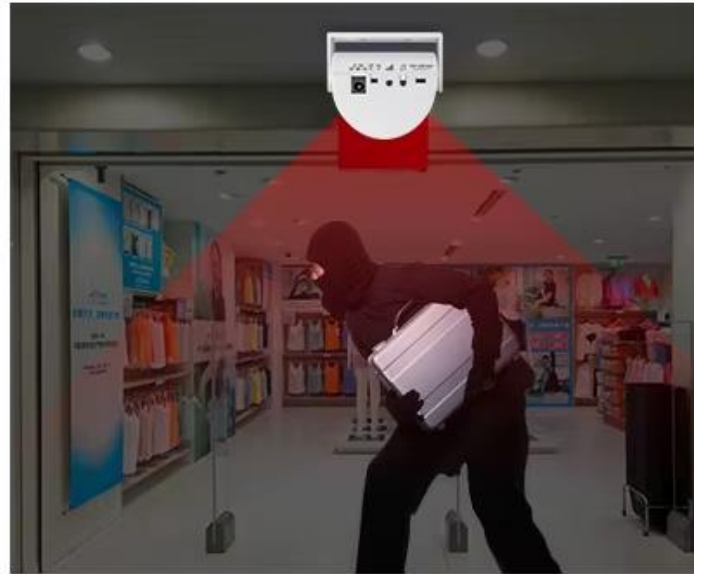
Alarm mode Set Alarm mode, anti-theft at night