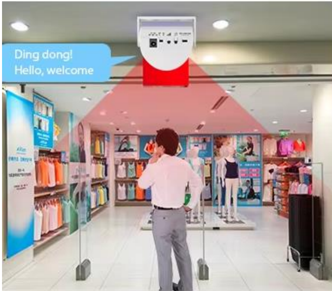
Welcome mode when customer come, it will sound "hello, welcome"