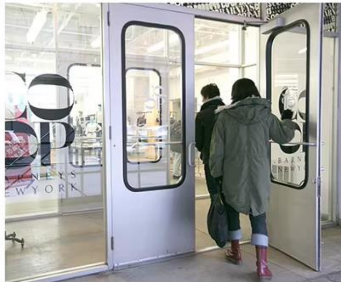
Welcome Chime Make you never miss a customer