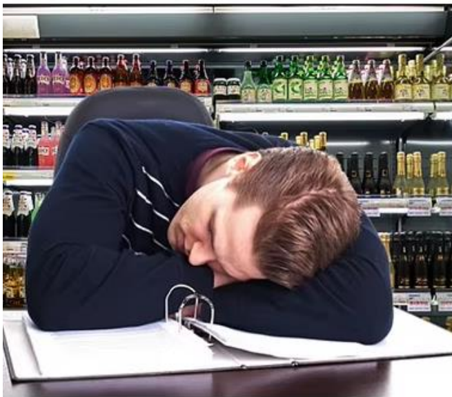
Remind function when have a rest at noon, can remind customer coming