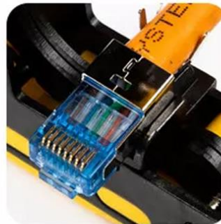
Crimp Metal Clip