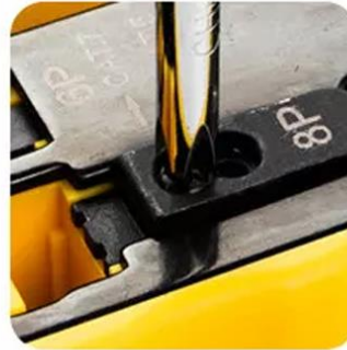
Cat.7 Fast Converted into Cat.5 & Cat.6