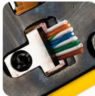
Crimp and Trim System