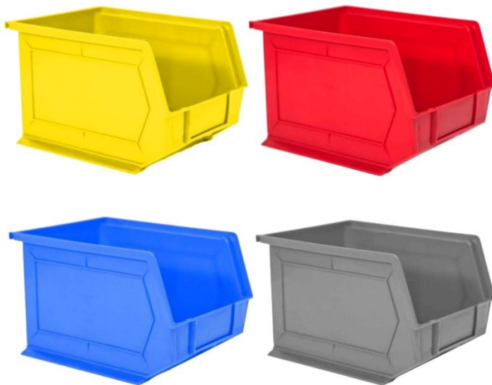
Características Técnicas Específicas de las Gavetas de Plástico DrawerLigth.

Los Contenedores DrawerLigth tienen una garantía de 1 año certificado por escrito, Sujeto a las cláusulas de garantía de VentDepot.